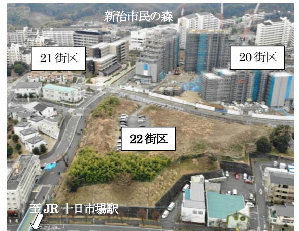
十日市場センター地区 航空写真

今後は、本市が SDG s 未来都市に選定されたことを受け、横浜型大都市モデルの創出を目指し、取組を進めていきます。