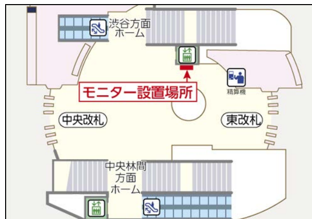
モニター設置場所 (精算機脇)

東急田園都市線 たまプラーザ駅 (参考：平成24年度 1日平均乗降人員75,967人)