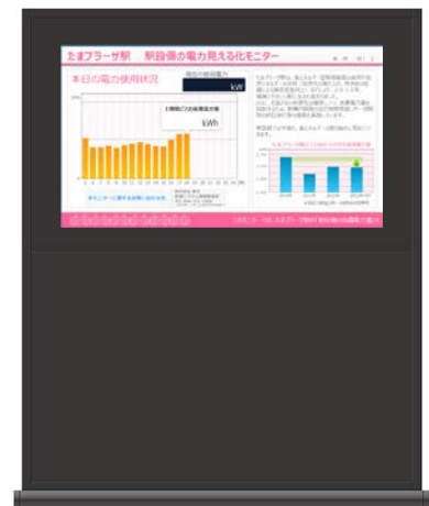
設置するモニター (イメージ)