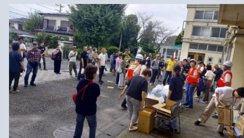
▲地域との訓練の様子