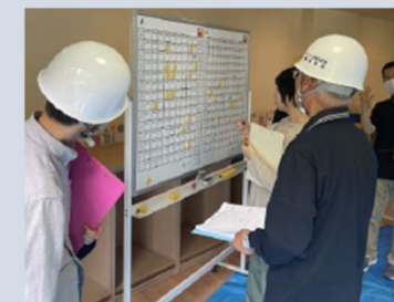
▲安否確認訓練の様子