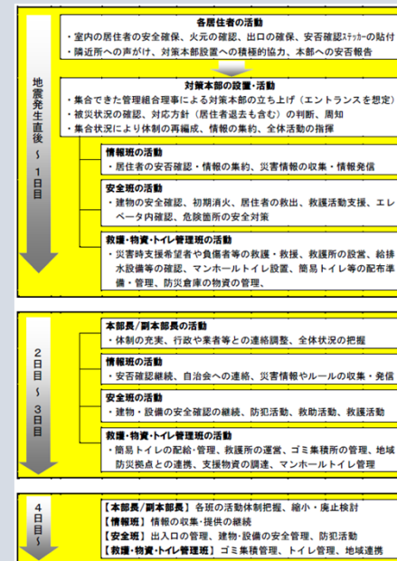
▲災害時の活動フロー