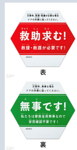
▲安否確認ステッカー