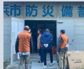
▲防災備蓄倉庫見学