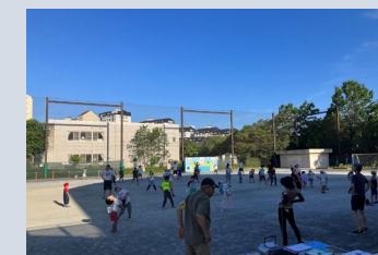
▲ラジオ体操の様子