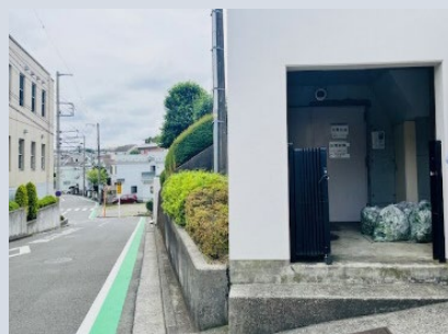
▲電気室と道路との位置関係

北東部に内水 0.5m の浸水想定があるが、敷地が道路より 0.5m 超高いため、建物内への浸水の恐れはない