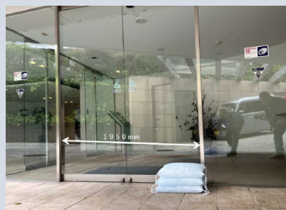
▲水のう袋設置イメージ

内水最大0.03mの浸水想定に対し、1階エントランス、地下1階駐車場出入口に水のう袋を設置し、浸水を防止