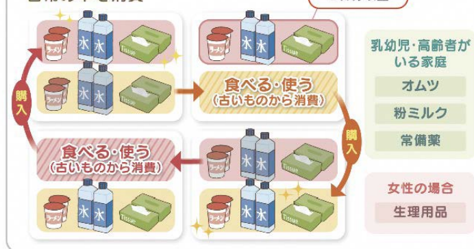
▲各住戸の備蓄の考え方