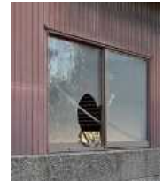
窓が割れた 管理不全空家