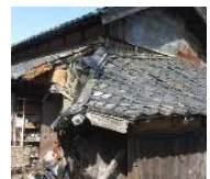
緊急代執行を要する 崩落しかけた屋根