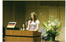
第17回ラウンジ祭り 「日本語スピーチ大会」