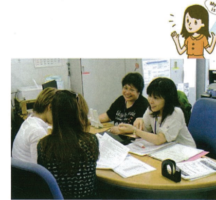
ラウンジ受付カウンター 「窓口相談風景」