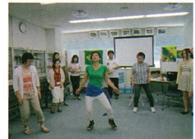
カルチャー交流サロン 「もっと知ってほしい私のブラジル」

横浜市港南国際交流ラウンジは、港南区役所の委託を受け、「NPO法人横浜港南国際交流の会」が運営しています。