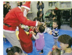
世界の赤ちゃんとママのひろば 「クリスマス会」