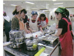
料理で国際交流 「皮から作る小籠包」

私たちは、地域で暮らす外国人に日常生活に必要な情報を提供・サポートをしています。また「世界の料理教室」や、世界の文化を紹介する「カルチャー交流サロン」などを開催し、外国人と地域の人々との交流を深める活動をしています。