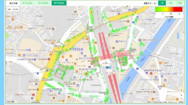
喫煙禁止地区指定後