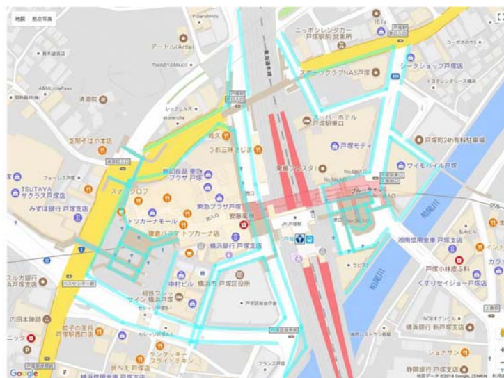
戸塚駅周辺の調査ルート