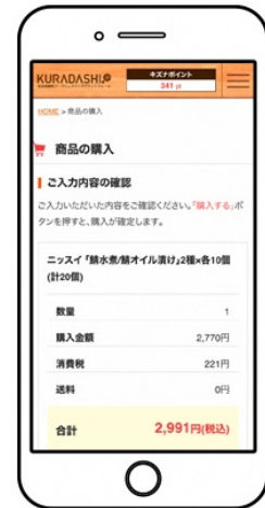
▲ 入力内容を確認のうえ「購入する」