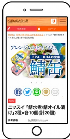
▲ 様々なジャンルの中から商品を選ぶ