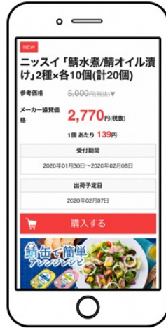
▲ お気に入りの商品を見つけたら「購入する」