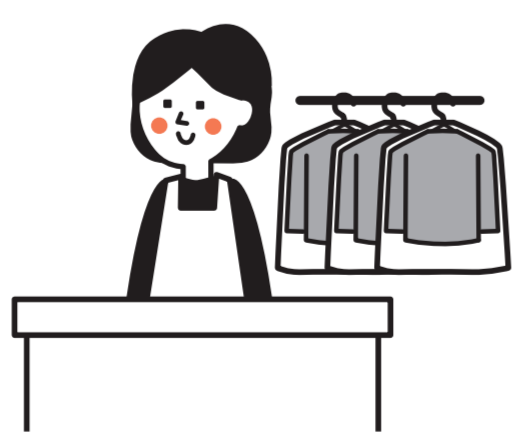
クリーニング店で