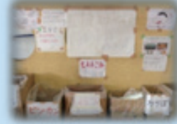
▲避難所での分別の取組