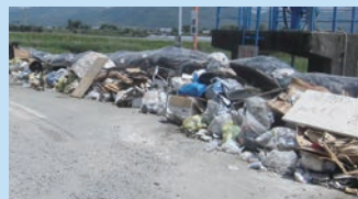
▲分別されずに排出された災害廃棄物

生活ごみの集積場所とは別の交通の妨げにならない場所に排出してください。 ※衛生環境の悪化や生活ごみの収集に支障とならないよう、 生活ごみと必ず区別してください ※収集日・分別の方法等は別途広報します