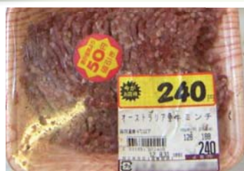
特売で買って、使わなかったお肉