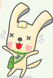
「ヨコハマ3R夢(スリム)!!」 マスコット イーオ