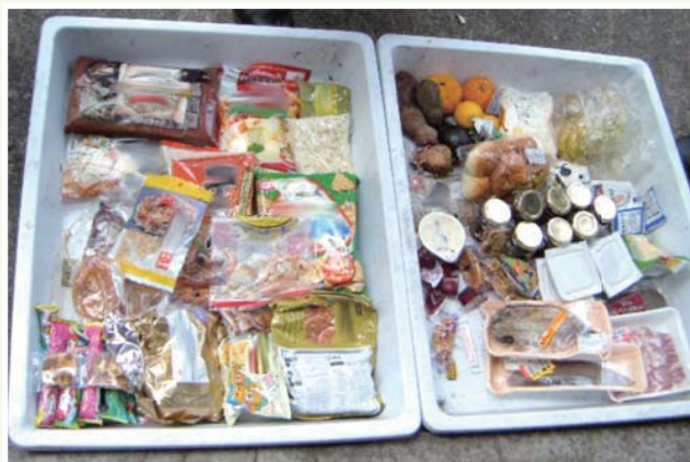
集積場所4か所(約140世帯)から 1回の収集で出た「手つかず食品」