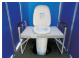
下水直結式仮設トイレ