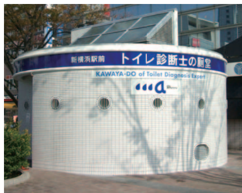
ドゥ アメニティ 新横浜駅前 トイレ診断士の個室