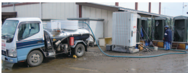
東日本大震災の被災地における災害復旧支援

災害時のし尿処理対策は衛生的、生理的な観点から、早急に対処すべき課題の1つです。地域防災拠点には多くの避難者が集まるため、設置された仮設トイレから衛生的かつ迅速にし尿を収集し、水再生センター等へ運搬する必要があります。北部事務所は、災害発生後2日目から順次くみ取りを開始します。