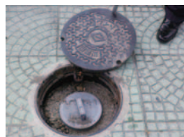
下水直結式仮設トイレ用マンホール

このトイレは水道が使用できない場合でも、プール等の水を活用してトイレの汚物を下水管へ流すことができます。