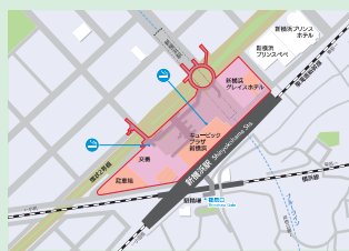
新横浜駅周辺地区