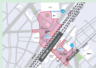
東神奈川駅周辺地区