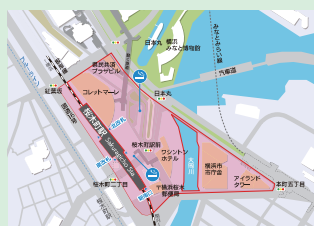
みなとみらい21地区