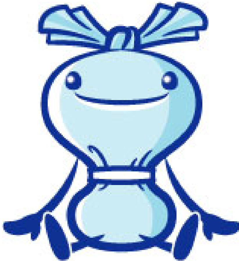
「ヨコハマは G30」マスコット へら星人 ミーオ