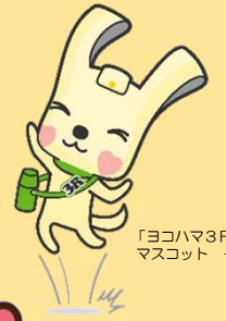
「ヨコハマ3R夢！」 マスコット イーオ