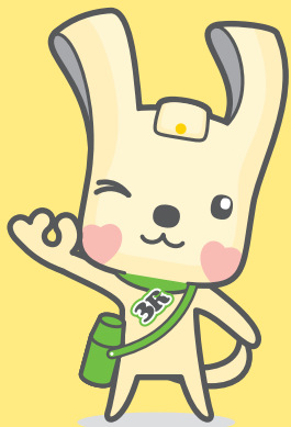
ヨコハマ3R夢! マスコット イーオ