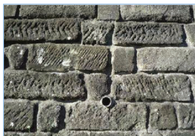
ブラフ積擁壁の利活用