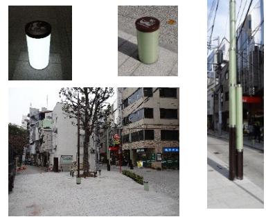
石川商店街環境整備支援事業 実施設計