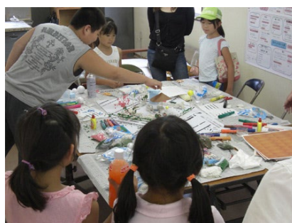
鶴見区・市場西中町 きらきら公園整備