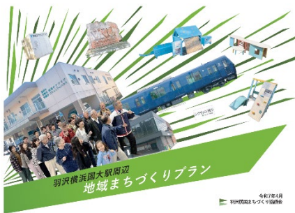
羽沢横国まちづくり協議会 地域まちづくりプラン