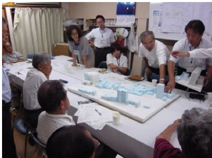
神奈川区・浦島町 共同建替え検討