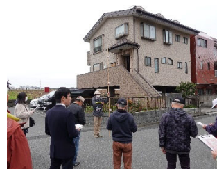
防災情報講座で防災まち歩きのガイド