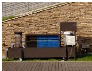
ピークカット型雨水流出抑制・雨水利用の研究開発・提案