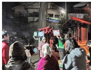
西戸部地区防災訓練と避難路の愛称プレート紹介