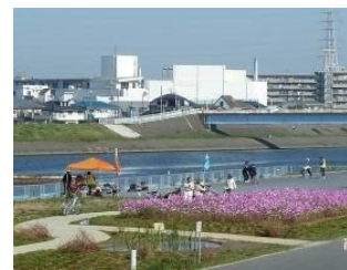
駒岡大曲広場の整備、防災船着場との連携整備の調整・支援