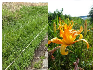
花さく鶴見川プロジェクトへの参加(ヤブカンゾウ等の育成等)