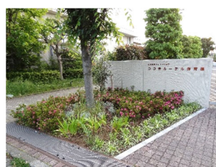
通学路沿いの地域緑化の支援(つづきルーテル保育園前)