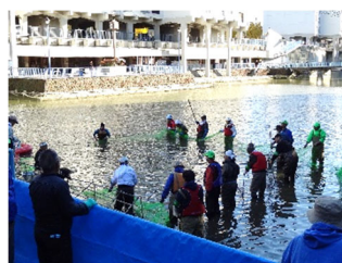
竹山団地地域緑のまちづくり支援(池のかいぼり・周辺緑化等)