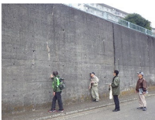
水取沢防災まちづくりの会による地域の擁壁等の現況点検