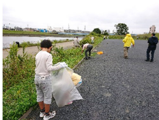
駒岡河川敷合同クリーンアップ