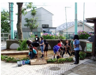
子どもたちによる雨水利用学校ビオトープづくりのサポート