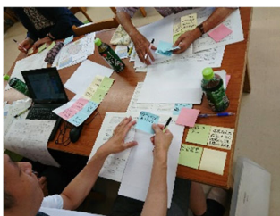
「公園をつくる話をしよう」J.W.S.の支援(一本松まちづくり協議会)