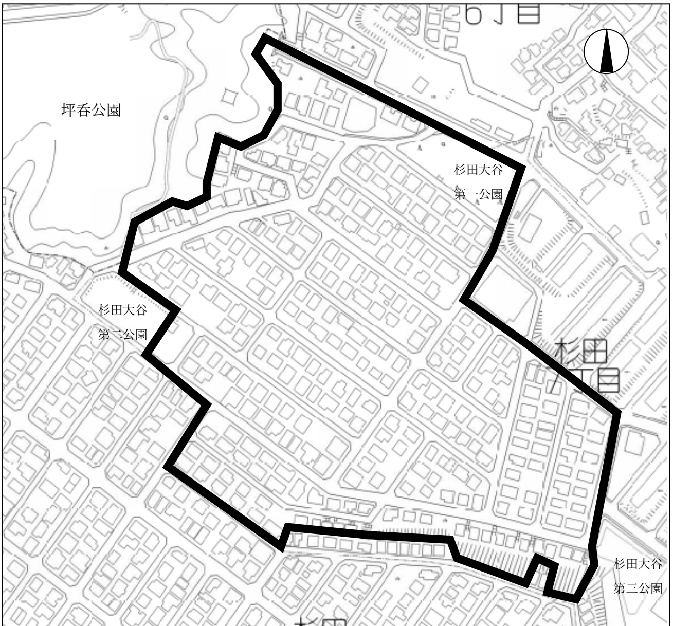
<別図1 (メール・ド礪子まちづくりルール区域図) >