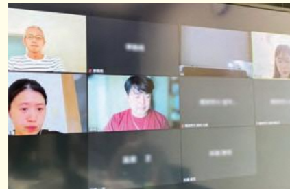
オンラインミーティングの様子