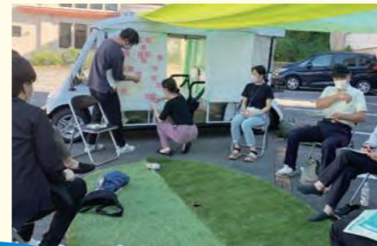
公開ミーティングの様子