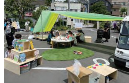
おかまちフォーラムの様子(富岡地区)