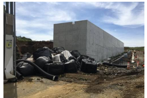
台風後現場状況写真