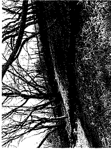
第2谷戸 荒磯川源流付近（日本庭園几竜跡）