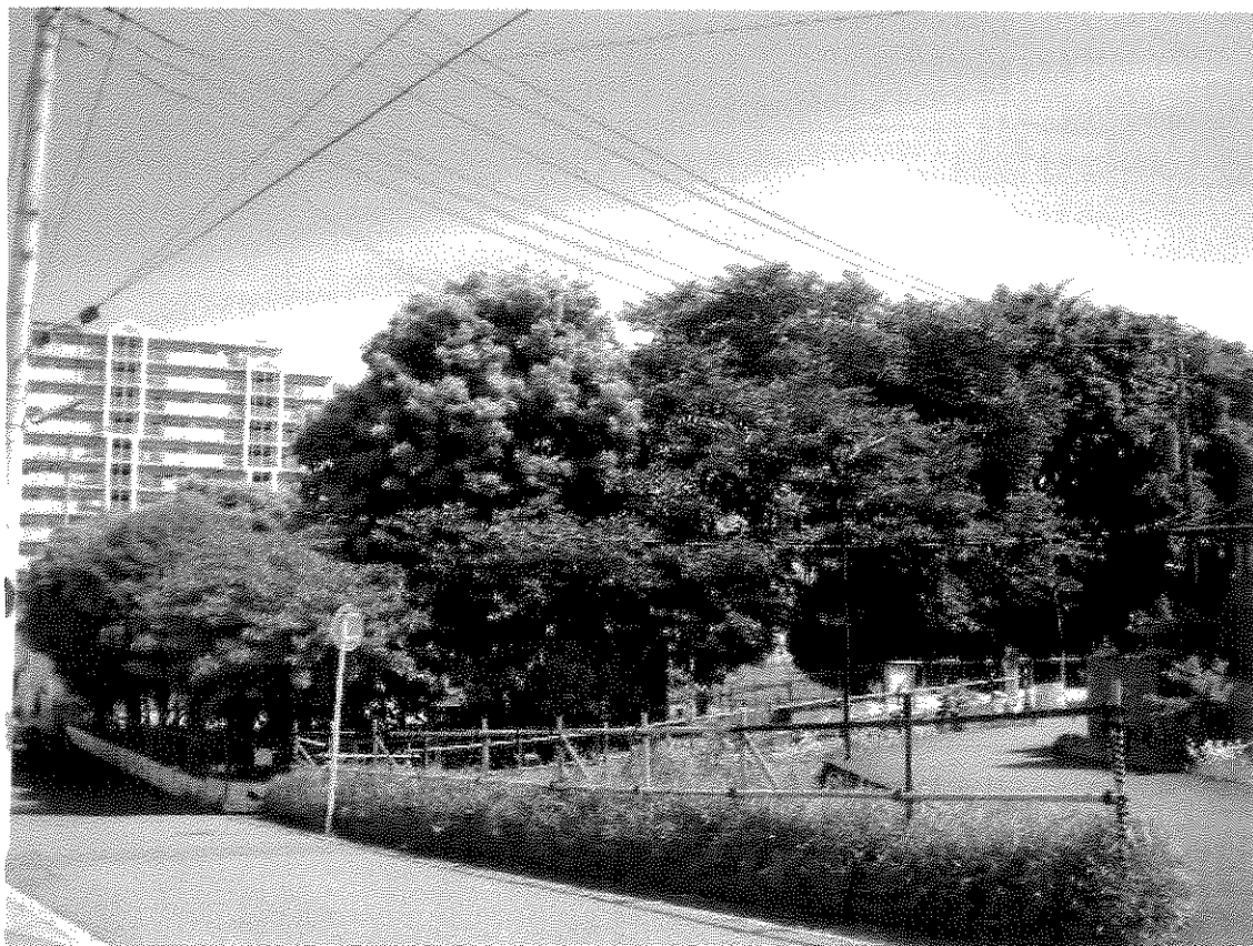
【 広場の南西から撮影 】