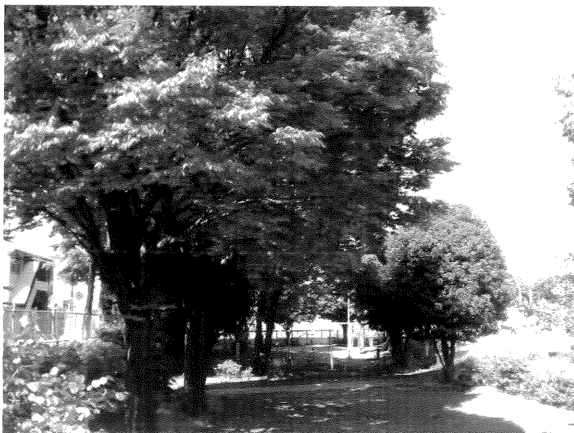
【 広場内から撮影 】