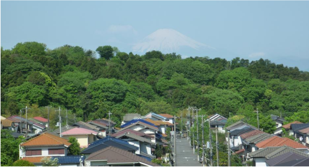
富士山展望の丘・果樹農園予定地付近の写真