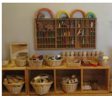
おもちゃコーナーイメージ