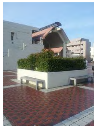
菜園利用希望の商店街内の花壇