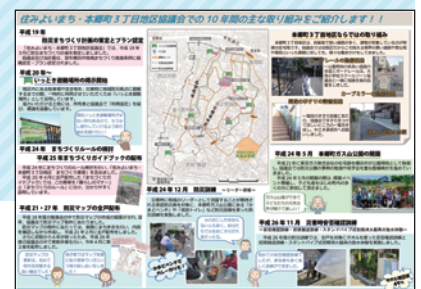
周知のためのニュース