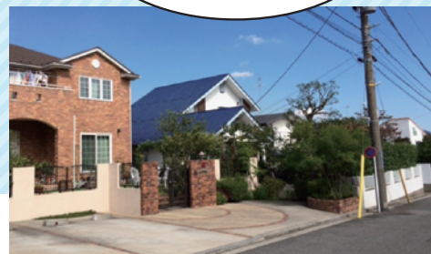
良好な環境が保たれた住宅地