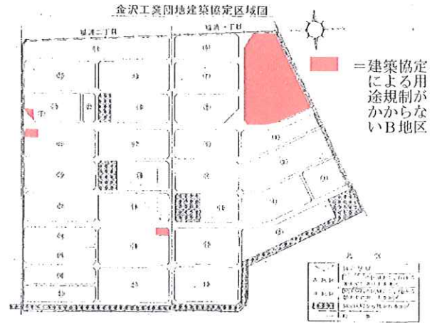
図 1：建築協定によるコンビニ出店規制区域（上地区の赤敷地以外）