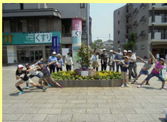
駅前広場に整備された花壇の様子

また、空き家を活用した交流拠点の整備も行い、遊びや体験を通して子どもと大人が交流する場づくりに地域一体で取り組み、地域課題の解決を実践しています。