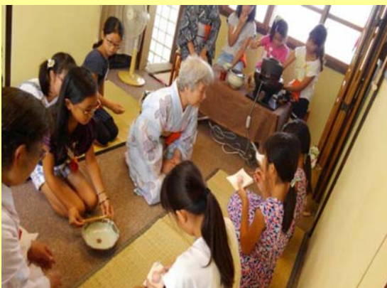
「人材マップ」を生かした活動の様子