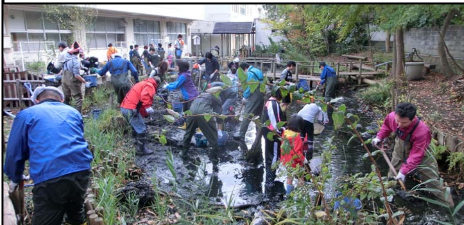
▲金沢区でつくられる風景 ふるさと大道村 トンボ池の手入れの様子