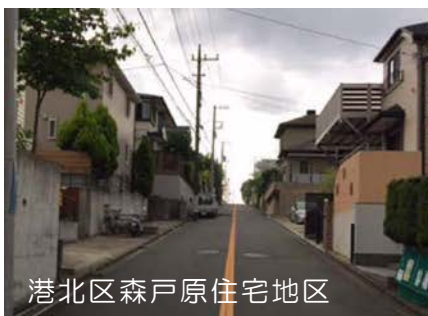
港北区森戸原住宅地区