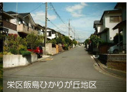
栄区飯島ひかりが丘地区