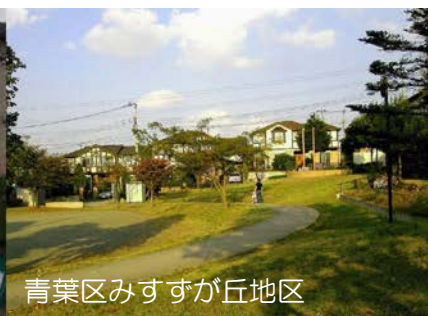
青葉区みすずが丘地区