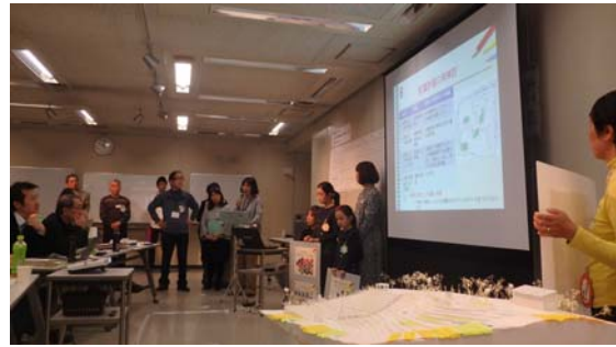
「太陽公園愛護会グループ」の発表