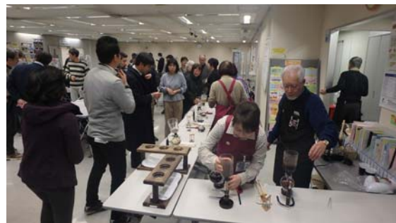
コンテスト後の交流会