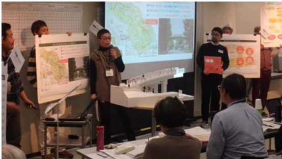
「美しが丘アセス委員会」の発表