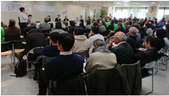
コンテスト会場の様子