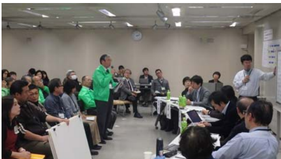
提案グループと審査員の質疑応答