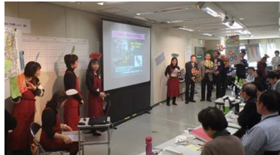
「宮ノマエストロ」の発表