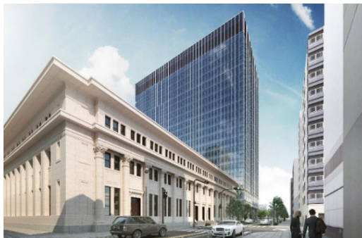
手前：A-2地区、奥：A-1地区（完成予想図）