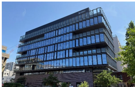
B地区（令和7年3月竣工）