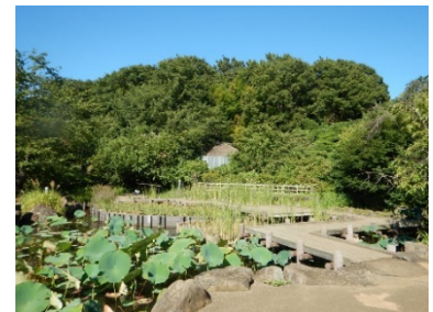
馬場花木園内（池越しに見る東屋）

【歴史を生かしたまちづくり要綱に基づく歴史的建造物の認定年月日】平成4年1月31日