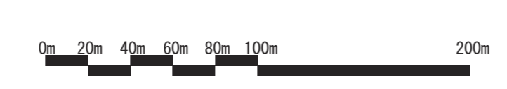
図名：計画図1の8 景観重要公共施設