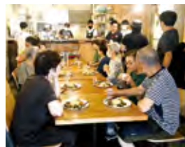
▲ 健康ランチ(神大喫茶)