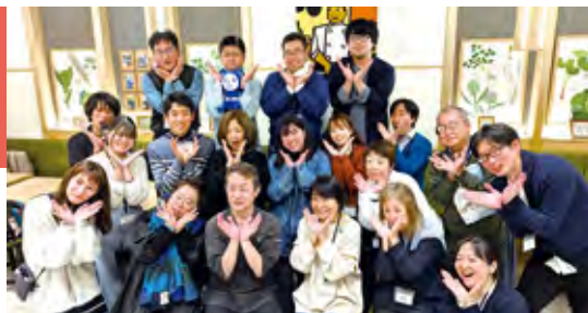
▲18区井ナイトフェスティバル

https://dokohoru.base.shop/ https://www.instagram.com/tsubaki_shokudou https://www.facebook.com/tsubaki.ygc