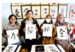
▲ 書道体験ワークショップ