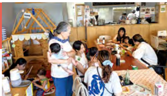
▲ カフェの利用風景