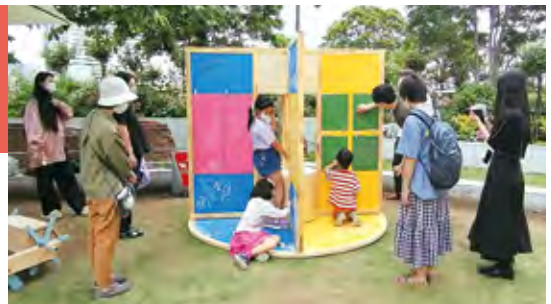
▲作品展示の様子(横浜市役所水辺プラザ)