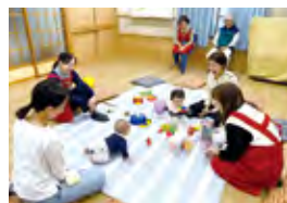
▲ 町内会館での様子