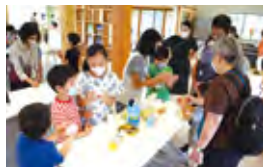
▲みんなで楽しむワークショップ