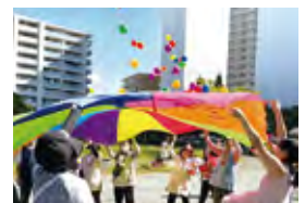
▲ 公園内のかめっ子でパラバルーンあそび