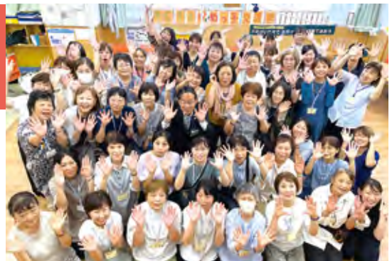
▲ 各子かめ代表スタッフ集合写真