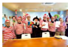
▲ シニアウォーラーを探せイベント