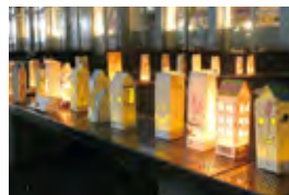
▲キャンドルホルダー点灯