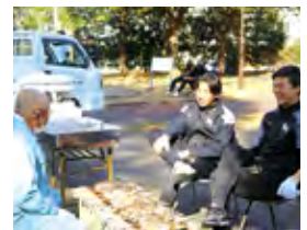
▲ 卒業生送別会で住民が学生のためにマスを釣ってきました