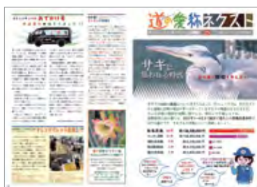
◀ 道の愛称ネクスト 広報誌