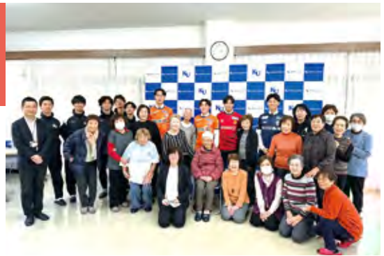
▲ 神奈川大学サッカー部出身者のリーグ加入内定の記者会見