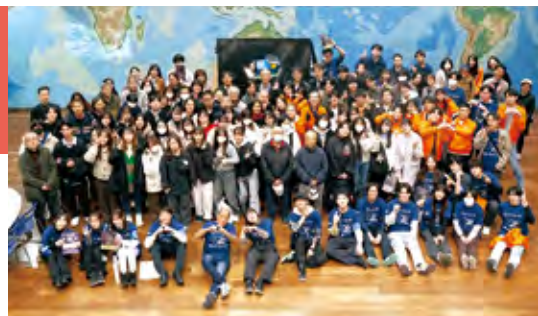
▲キャンドルナイトのメンバーによる集合写真