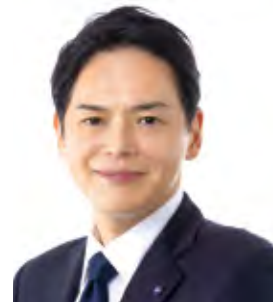
横浜市長 山中 竹春

横浜の魅力・にぎわいを高めてくださっている受賞者の皆様に厚く御礼申し上げますとともに、皆様の今後益々の御活躍を心より祈念しております。