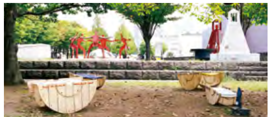
▲作品展示の様子(グランモール公園)