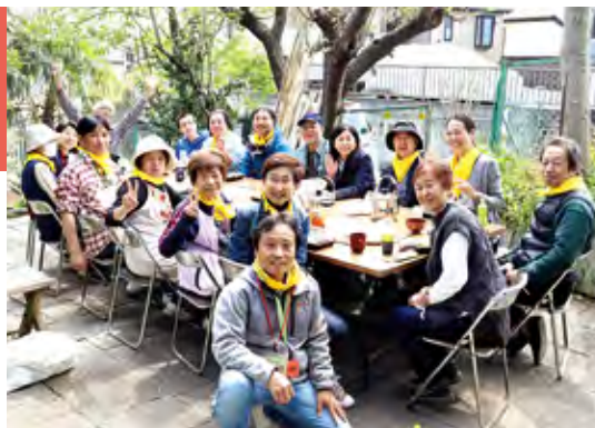
▲ イベント後の交流の様子