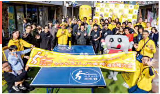
▲全かなスリッパ卓球選手権大会の様子