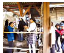
▲ 登り窯イベントの様子