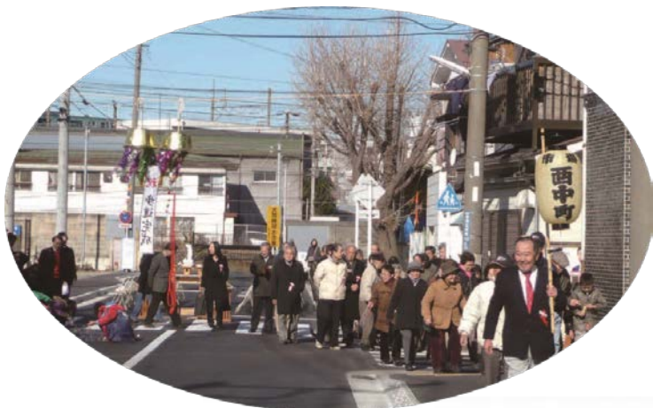
▲ 第9回横浜・人・まち・デザイン賞 【地域まちづくり部門】受賞