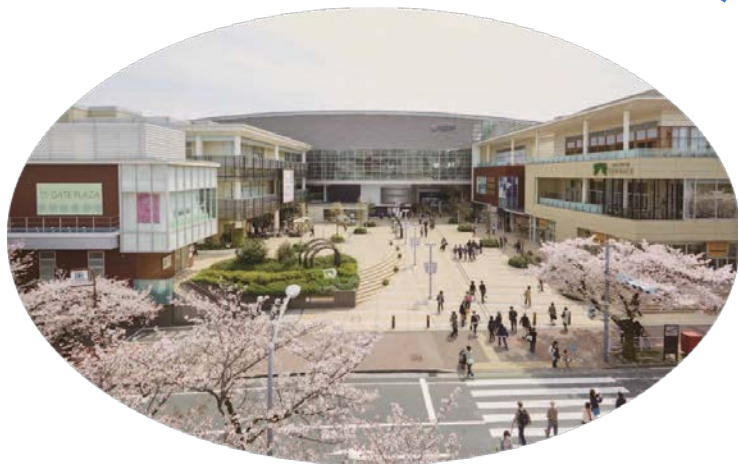
▲ 第9回横浜・人・まち・デザイン賞 【まちなみ景観部門】受賞 「たまプラーザ駅とたまプラーザ テラス」（青葉区）