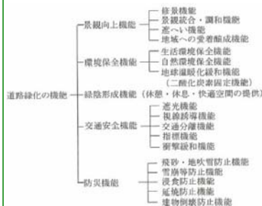
図 1-1-1 道路緑化の機能