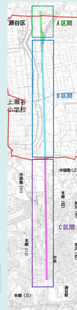
(仮称)旧上瀬谷通信施設地区 土地区画整理事業区域