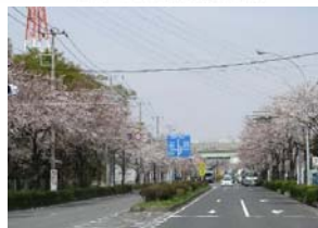
目黒交差点以北にもソメイヨシノが植栽。(ヨウコウに植替え中)