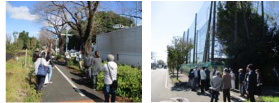
第2回現地説明会の様子