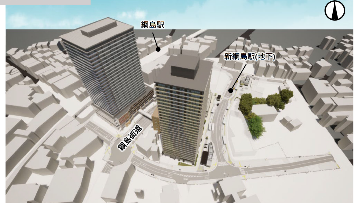
※令和4年7月時点のイメージ、計画であり、今後関係者協議等により変更となる可能性があります。