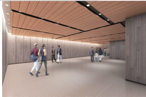
※令和4年7月時点のイメージであり、今後変更となる可能性があります。