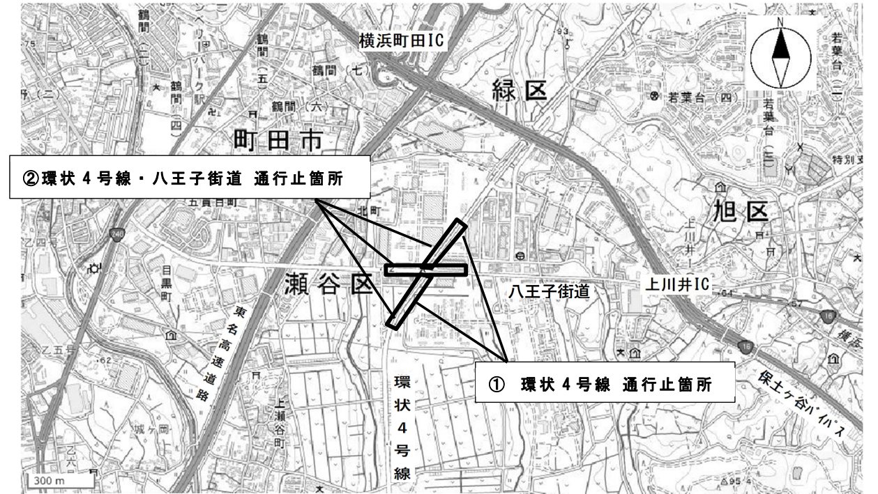
※ 電子地形図（国土地理院）を加工して作成