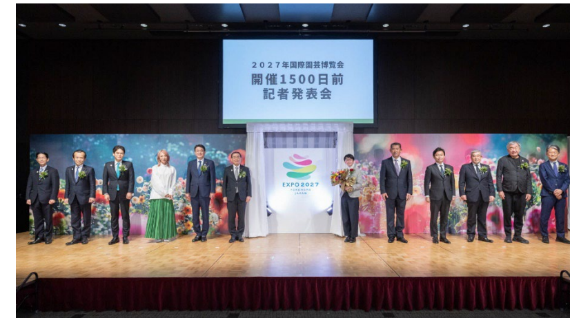
開催1500日前発表会の様子