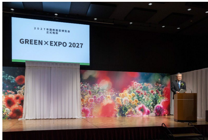
正式略称発表の様子

令和4年10月20日から11月5日まで行った一般応募により、1204作品のご応募をいただきました。その中から、「デザイン審査」、「知的財産権関連調査」を行い、最終候補作品を選出し、博覧会に関わる有識者や専門家などによる「選考委員会」の選考により決定しました。