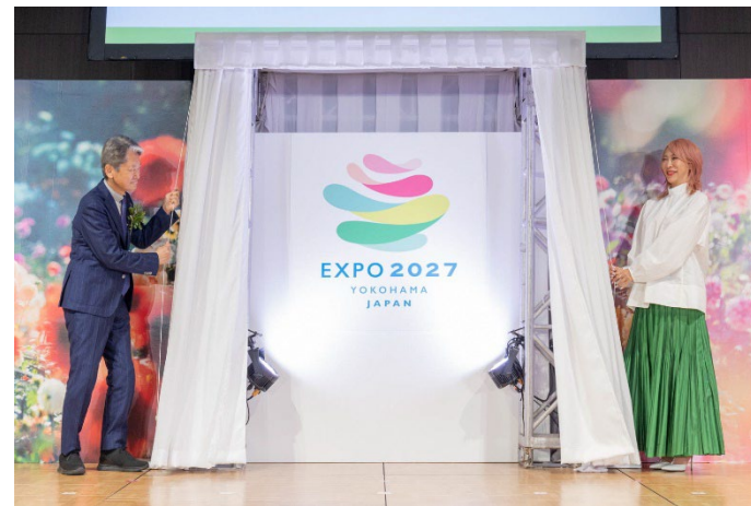
公式ロゴマーク最優秀賞作品発表の様子