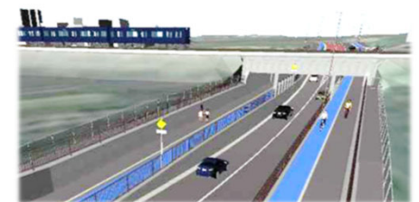
相模鉄道と交差するアンダーパス部イメージ図