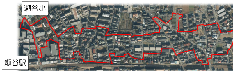
地域説明会でお示した施行地区の案（赤線の内側）

この説明会では、公共施設（道路、調整池）の配置計画や施行地区案をお示ししました。延べ134人の方にご参加いただき、様々なご意見を頂きました。