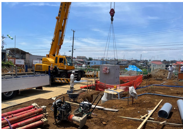
【電線共同溝工事の状況】

地区西側の都市計画道路や宅地などを整備しています。現在は、道路の下に埋設する、電線共同溝や下水道、ガス管、宅地などの工事を主に進めています。