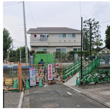
【東野団地への通路：6月12日から仮設通路の通行をお願いしています】