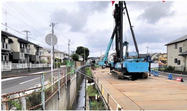
【東野水路付近の現況】

今後、仮排水路の設置、既存水路の撤去、BOXカルバート（地下水路となる箱形のコンクリート構造物）の敷設の順に工事を進めていきます。