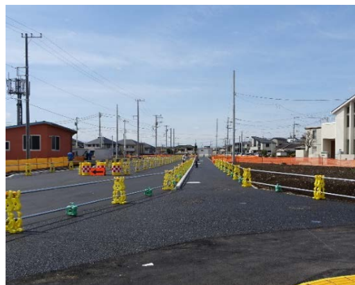
【歩行者通行可能範囲図】

本線の車道部分および二ツ橋北部自治会館前面歩道（下図の灰色部分）は一般の方は現在立入り禁止となっておりますが、8月以降に開放する予定です。